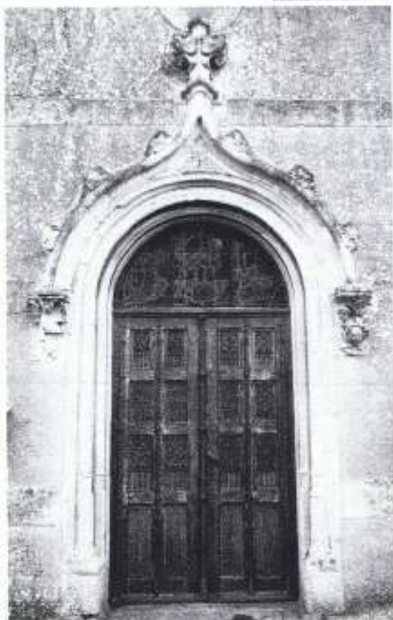
La porte de l'église de St léger